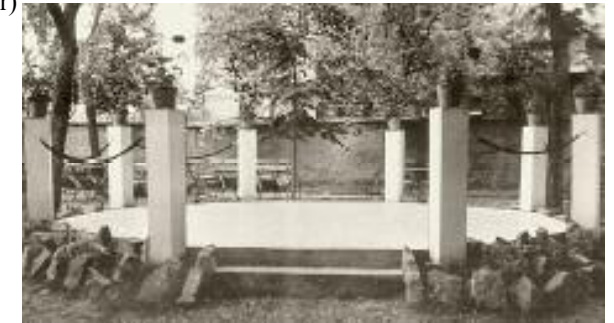
1907 / 08