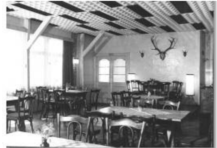
Inneneinrichtung der "Grünen Tanne" in den 70er Jahren.