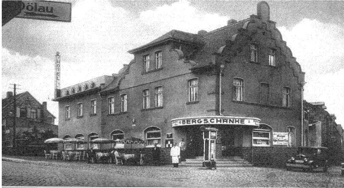
Postkarte der Bergschenke von 1941